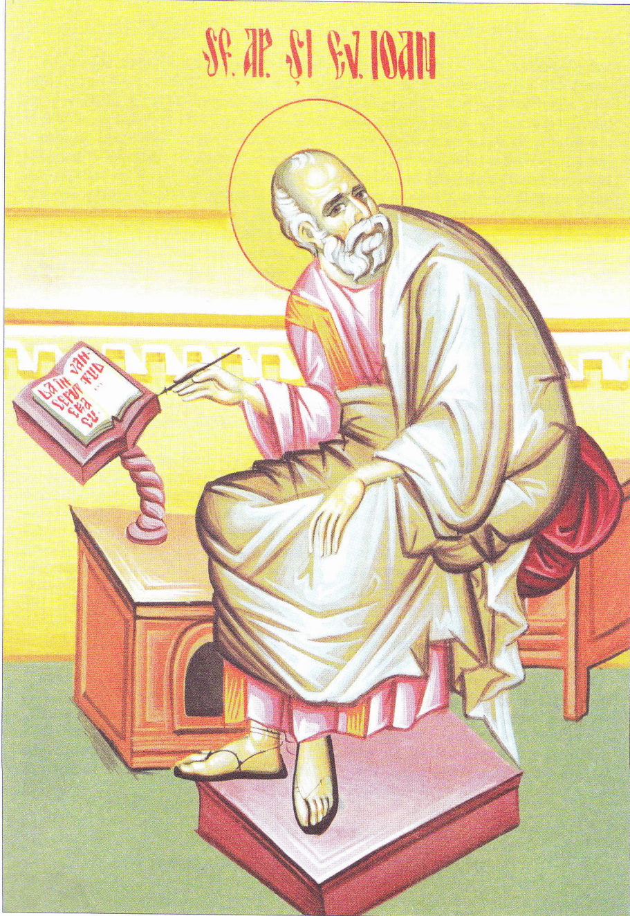
Sfântul Apostol și Evanghelist Ioan